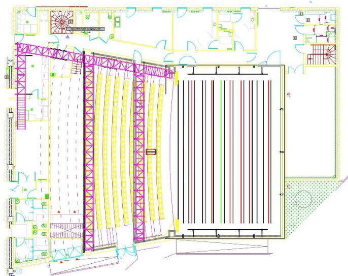
ECRIN TALANT MASSE A3 100eme